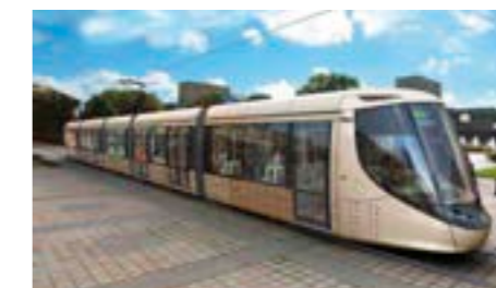
Tramway/fer du Havre.

Le futur mode de transport desservira 37 stations avec 24 rames de 32 m de long (210 places au lieu de 128 dans l'actuel TVR). « Demain, il sera un des piliers du développement de l'agglomération caennaise », ajoute Rodolphe Thomas, vice-président de Caen la mer en charge des transports. Il pourra transporter 64 000 voyageurs contre 42 000 aujourd'hui. A moins de 500 mètres d'une station, il desservira 74 000 habitants, 47 000 emplois et 27 000 scolaires et étudiants.