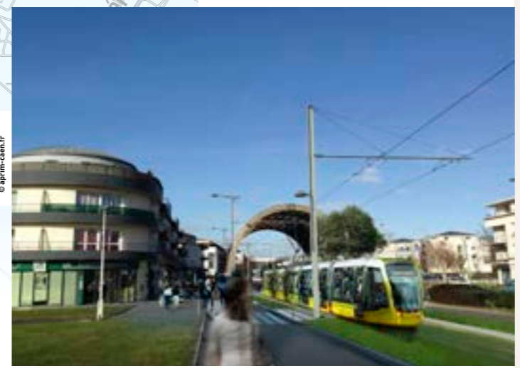
Vue d'artiste d'un tramway/fer à Ifs.

Dès l'arrêt du tramway sur pneus en janvier 2018, nous serons très vigilants sur les moyens de transport de substitution qui permettront aux habitants de l'agglomération de se déplacer dans les meilleures conditions possibles pendant les 18 mois de travaux. Nous mettrons en place une information diffusée aux usagers et habitants de l'agglomération. La sécurité et la tranquillité des riverains feront également partie de nos priorités.