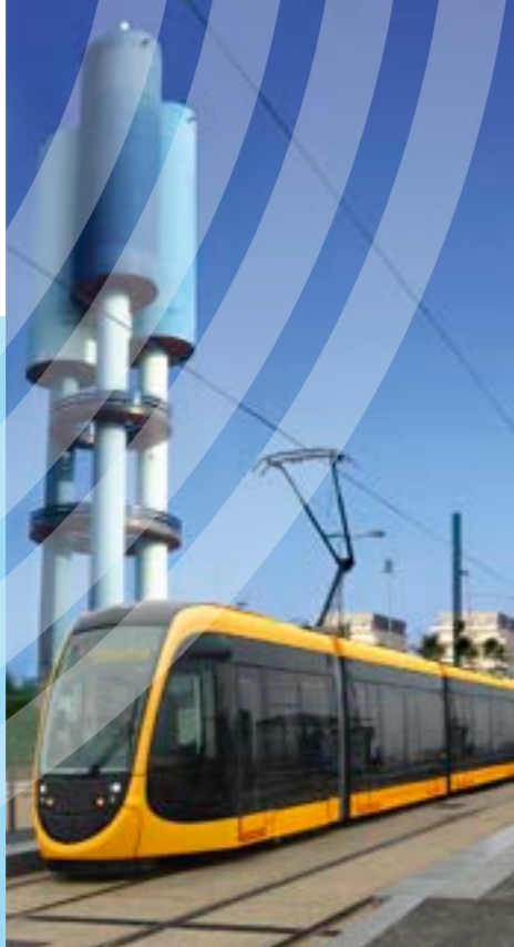
Vue d'artiste d'un tramway/fer à Hérouville Saint-Clair.

D'un montant de 230 millions d'euros, le futur tramway bénéficie de subventions déjà acquises de l'Etat à hauteur de 27 millions d'euros (dont 3,6 millions pour mise en conformité du TVR) et du Département du Calvados pour 45 millions d'euros. En outre, d'autres subventions ont également été sollicitées : 15 millions d'euros auprès de la Région Basse-Normandie et autant auprès de l'Europe (fonds FEDER). Un autofinancement sur les fonds propres de Caen la mer à hauteur de 14,5 millions d'euros et un emprunt long terme compléteront ce plan de financement.