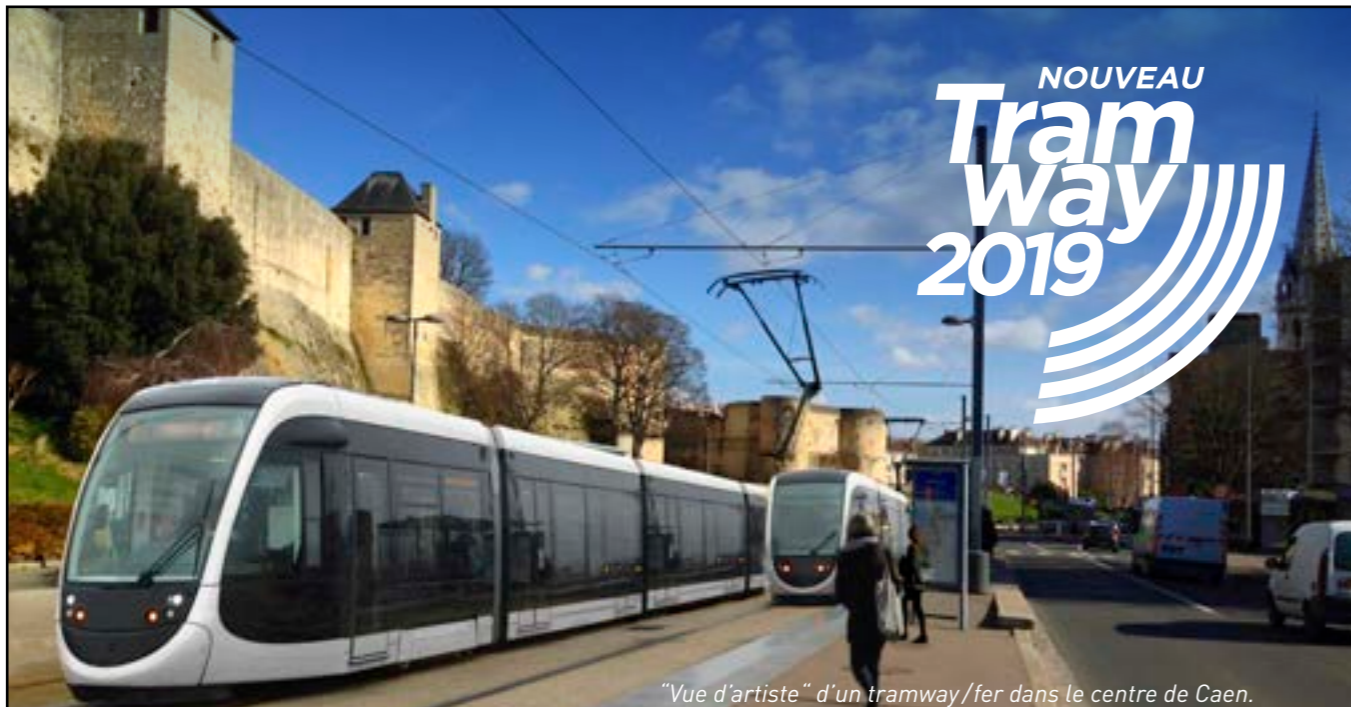
"Vue d'artiste" d'un tramway/fer dans le centre de Caen.